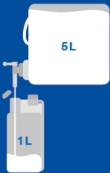
1 5 Liter Kanister