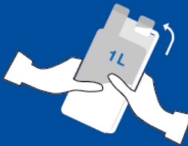
2 1 Liter Dosierflasche